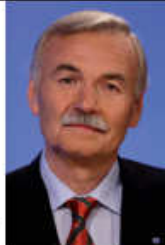
Minister-Grüßwort für Energie-Spar-Tage MV in den Metro Einkaufszentren in MV

Wer heute sein Haus sanieren will, wird das Hauptaugenmerk auf eine Verbesserung der Energiebilanz legen. Die Entwicklung der Energiepreise – für Öl und Gas haben sie sich in den letzten zehn Jahren nahezu verdoppelt – lässt uns keine andere Wahl. Über 25 % der Gesamtenergie in Deutschland verbraucht der Gebäudesektor, es gibt deshalb gute Gründe sich Gedanken über seine eigenen vier Wände zu machen.