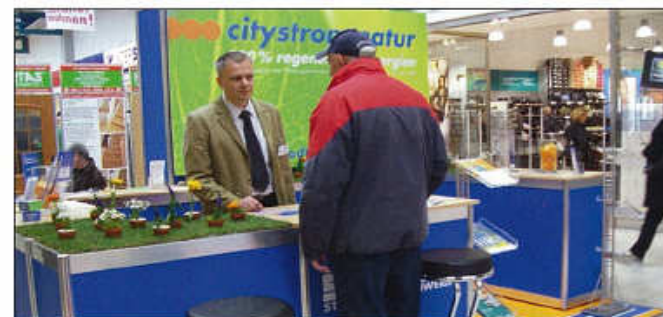
Die Mitarbeiter der Stadtwerke bieten an ihrem Messestand eine kompetente Beratung zu allen Fragen rund um das Thema Energie

Auf das vielseitige Programm werden wieder die „Klimapinguine“ im Center hinweisen. Die kleinen Besucher können im Umweltmobil ANU experimentieren und dabei die nachhaltige Energienutzung ganz praktisch erleben.