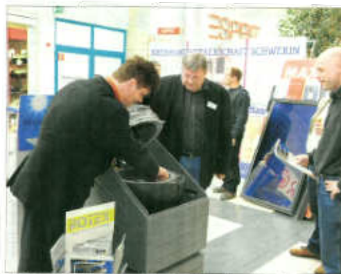
Das Thema an der Energiespar-Tage ist sehr aktuell. Hier werden die Möglichkeiten der Energieeffizienz aufgezeigt.