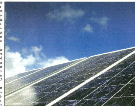
Wird sie das sein, die absolute Energieversorgung der Zukunft: Solartechnik? Auch darauf gibt die Messe Antworten – zum Beispiel innerhalb der Vortragsreihe am Sonntagnachmittag.

Themenschwerpunkte sind dabei energiesparende Heiz- und Solartechnik, Einsparungen durch Altbau sanierte, zukunftsfähige Bauen; die Nutzung von Erdwärme und Wärmepumpen sowie Gefahren durch Autogas. Fragen zu Finanzierung und Fördermaßnahmen werden ebenfalls beantwortet.